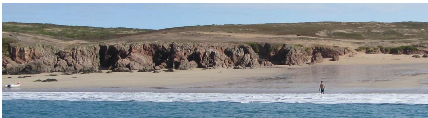
Houat (plage ouest)