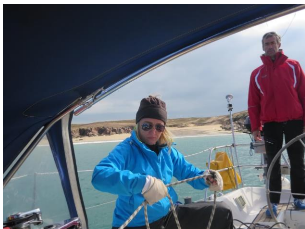
Appareillage de Neutron Rapide pour Belle Ile