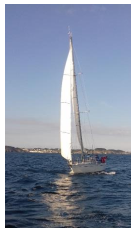
Rare photo de Neutron Rapide sous cet angle