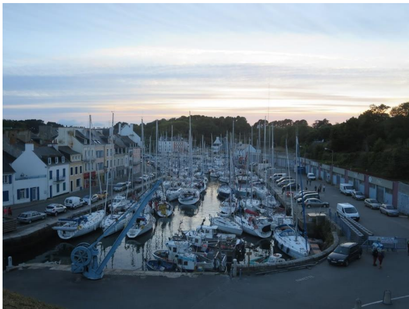
L'arrivé du Feeling 32 tel Artaban au port du Palais, à Belle Ile