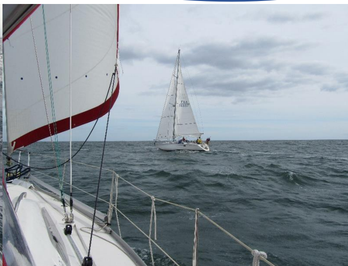
Neutron Rapide sous le vent du Feeling 32