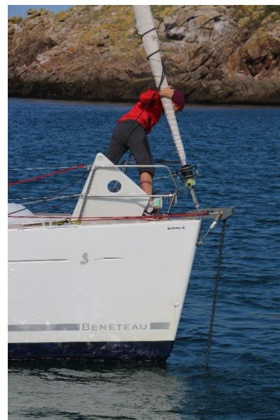
Mouillage à Houat