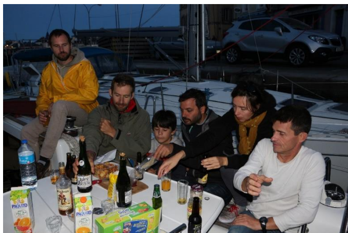
Le port du Palais samedi soir