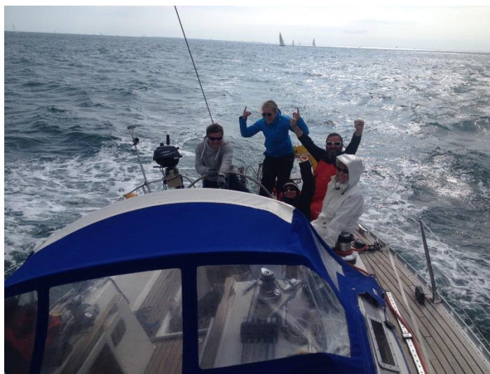
Pari gagné (champagne) : vitesse de 8.5 nœuds dépassée (8.7 nds)