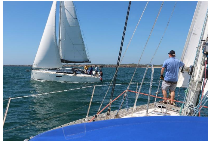
Match-racing entre Houat et Belle-Ile