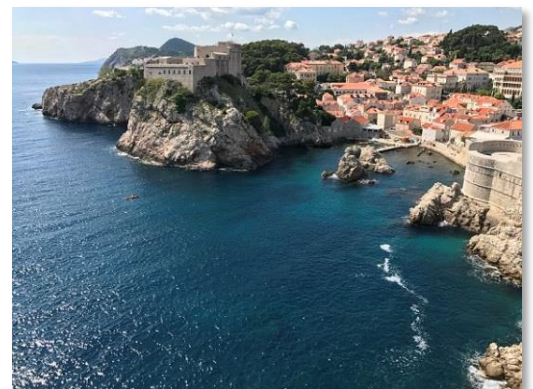
Mouillages et paysages de Dalmatie