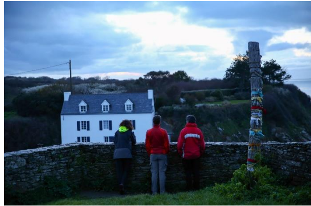
Ile de Groix, février 2018