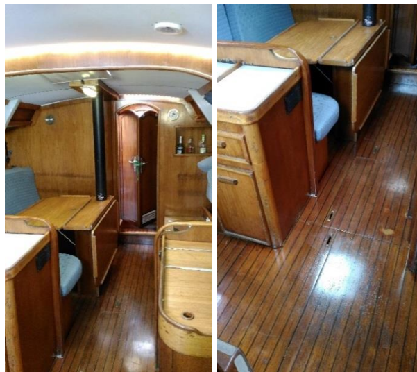
Nouvel éclairage et vernis

Après 2 tentatives repoussées pour cause d'épisodes neigeux, le WE entretien s'est finalement déroulé fin mars. En plus de la révision réglementaire des équipements de sécurité, de l'entretien courant, les planchers ont été vernis et des bandes leds ont été mises en place pour le nouvel éclairage du carré. Le carénage a été réalisé par le chantier naval.